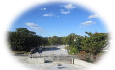
研修室から見える 四季折々の風景