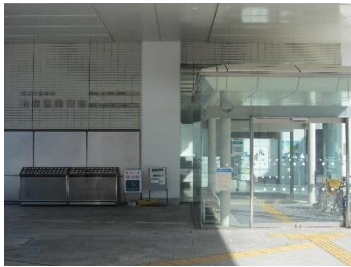
岐阜県図書館 正面玄関

平成 30 年度から岐阜県図書館と共催で、フリースペースを開催しています。 建物西側の正面玄関から入り、階段を上って2階へお進みください。