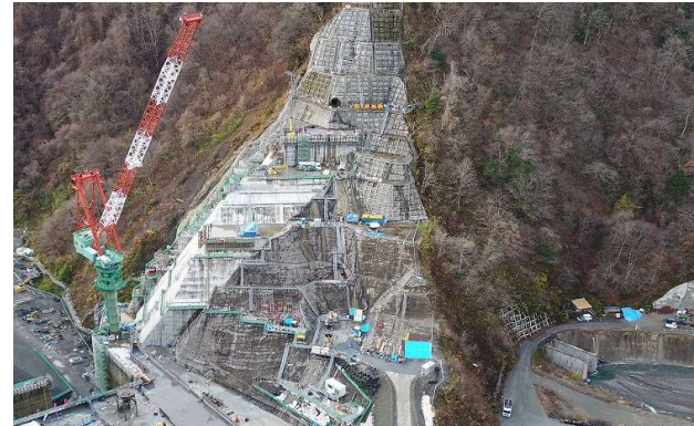
② ダムサイト右岸状況(左岸上空より望む)