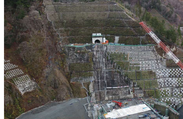
③ ダムサイト左岸状況(右岸上空より望む)