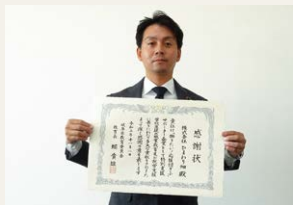
株式会社ひまわり畑

サポーター企業として3年間継続して、表彰項目のいずれかに該当した企業3社と、2回目の表彰となる1社の計4社に感謝状を授与しました。