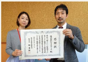
株式会社ウェルアーチ