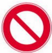
biển cấm dùng