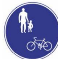
xe đạp và người đi