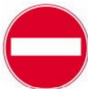
biển cấm tiến vào