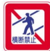
cấm người đi bộ