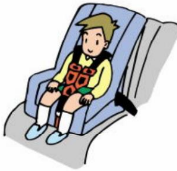
Ghế trẻ em