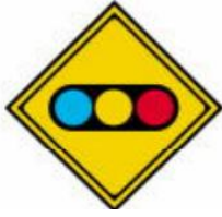
Có đèn báo