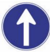
Biển báo chỉ định