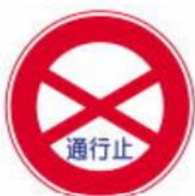
Biển cấm đi