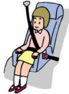
Ghế học sinh