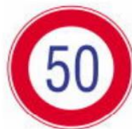
giới hạn 50km/h