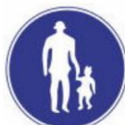
cho phép đi bộ