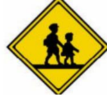
nơi có trẻ nhỏ