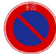
cấm đỗ xe