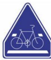
Dải cho phép qua đường