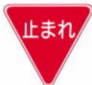
Dừng tạm thời