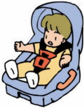
Ghế cho trẻ sơ sinh

Khi mà cho trẻ e chưa đến 6 tuổi lên xe ô tô,phải dùng chỗ ngồi mà vừa với cơ thể,cho ngồi ngay sau ghế thì an toàn hơn.