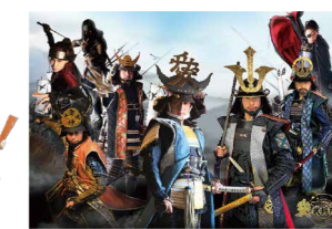
やまがた愛の武将隊(10日)