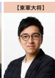
林輝幸 (クイズプレイヤー)