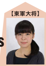
伊藤沙恵 女流名人