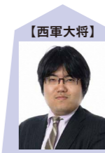
糸谷哲郎 八段 (第27期 竜王)