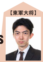
中村太地 七段 (第65期 王座)