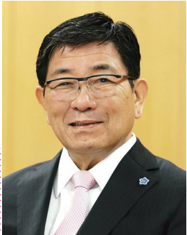
岐阜県知事 古田 肇

インポートのセレクトショップの店舗で、数多くの著名人の顧客を有する店長として一躍有名に。バイヤー、ショールーム運営を経て2000年に合同展示会「rooms」をスタート。展示会の新たな価値を創出し、2万人の来場者を動員する日本有数のキュレーションイベントとして成長させる。東日本大震災後、自身が福島県出身であることから、伝統工芸や地場産業にスポットを当てたプロジェクトを手掛け、福島県白河だるまを2万個売り上げるなど、プロデューサーとして企画から販売までをシームレスに繋ぐことで、数多くのヒット商品を生み出す。2018年になんでもプロデュースする会社「株式会社Fifty」を設立し、企業のアドバイザーに加え、人をプロデュースする仕事に幅を広げている。