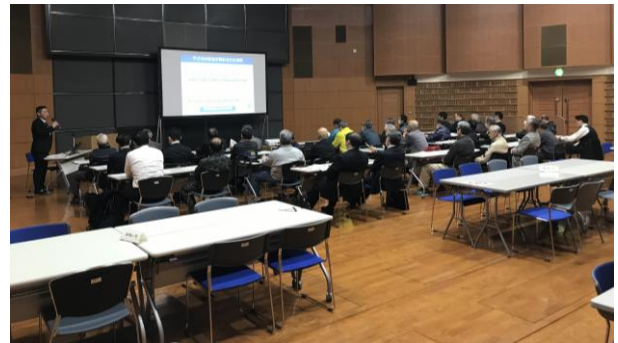
【岐阜地域：教育委員会講義】