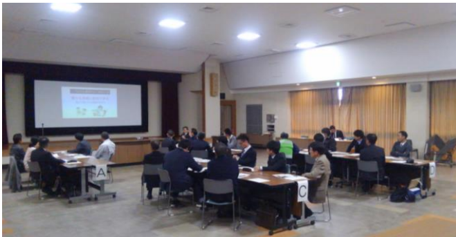
【中濃地域：県警講義】

令和2年度も開催を予定しております。詳細が決まりましたらお知らせいたしますので、対象地域となる方は、ぜひご参加ください。