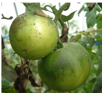
図3 すず病が発生した果実