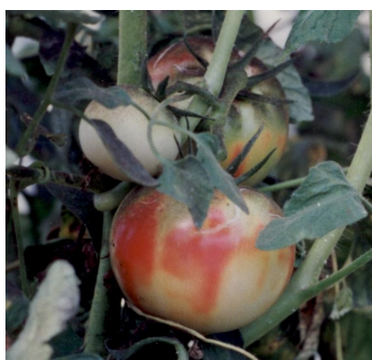
図4 果実の着色不良