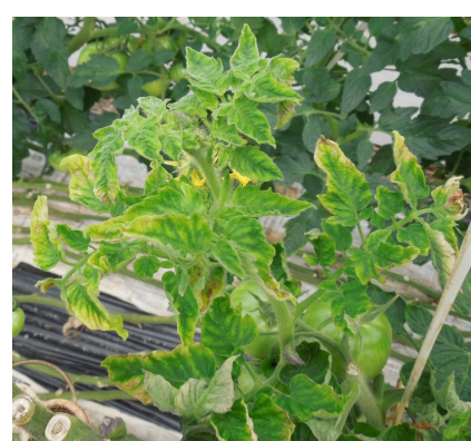
図5 トマト黄化葉巻病の発病株