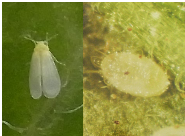
図1 オンシツコナジラミ成虫（左）と幼虫（右）