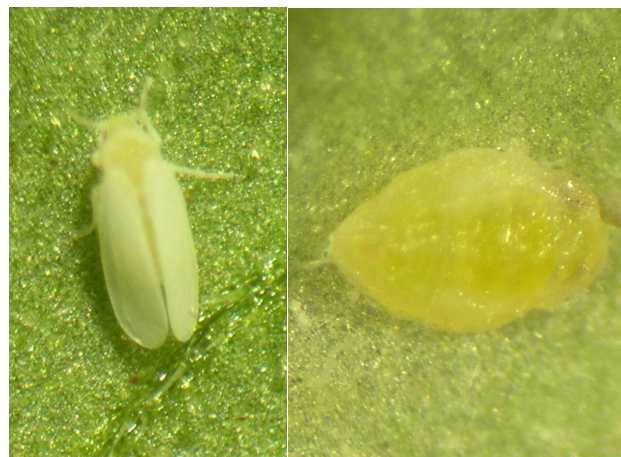
図2 タバココナジラミ成虫（左）と幼虫（右）