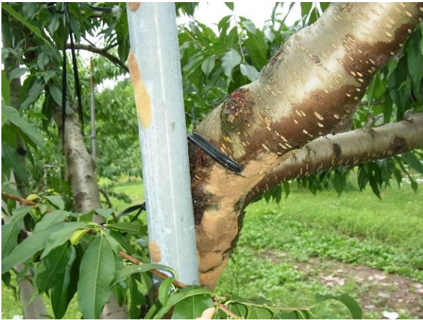
図1 モモに産下された卵塊