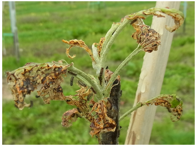
図2 リンゴ幼木の新芽を食害する孵化幼虫