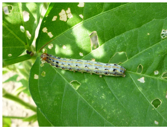
図2 老齢幼虫 (体長約40mm)