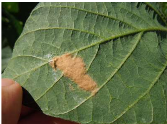
図3 大豆の葉に産み付けられた卵