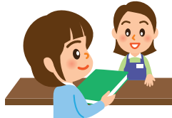
Pagbili ng libro