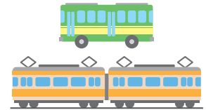
Pagsakay sa tren o bus