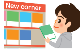
Pag rent ng DVD