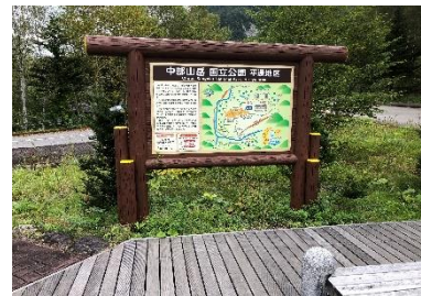
自然公園内の多言語案内板 （中部山岳 国立公園 平湯地区）