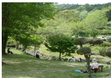
生活環境保全林（みたけの森）