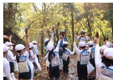
小学生の森林体験