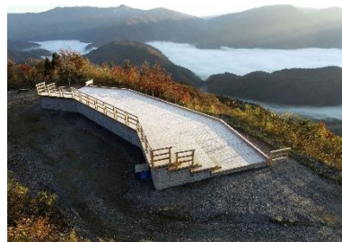
白川郷木製展望台 （白山白川郷ホワイトロード）