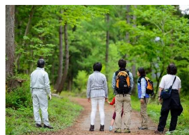
魅力的なプログラムの提供

新 森林空間を活用した新たなサービスの提供の中核を担う人材の育成を図るため、コーディネーターやツアーガイド等の育成研修を実施します。