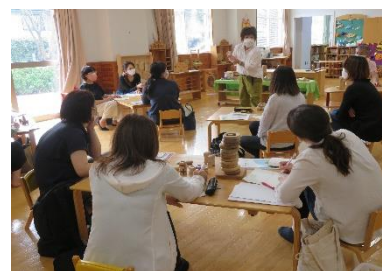
ぎふ木育ひろばスタッフ研修の実施