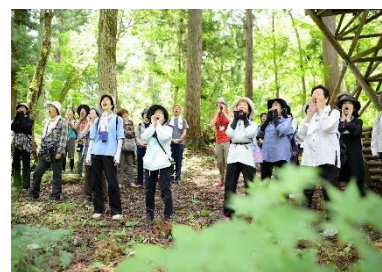
森の中での健康増進ウォーキング

新 事業者の意見交換やマッチング等を進め、森林サービス産業の振興を図るため、企業、団体、林業事業者、県、市町村、学校等で構成する「(仮称)森林サービス産業推進協議会」を設立し、この協議会を推進母体とし、各種事業を展開します。