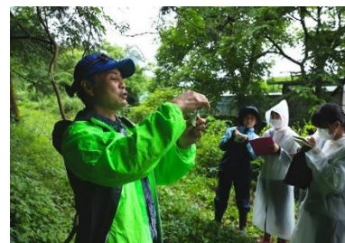
保育士への安全管理講習会