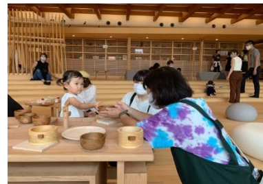
ぎふ木遊館 木育ひろば