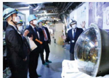
東京大学宇宙線研究所を視察

世界最先端の宇宙線研究施設（スーパーカミオカンデ、KAGRA）のほか、薬草資源を活用した「飛騨市薬草ビレッジ構想推進プロジェクト」の取組みや、地域一体となった新たな働き方等を提案するシェアオフィスの取組みについて調査しました。