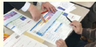
災害・避難カードを記入する様子

そのため、今年度中を目途に、こうした行動を促す効果的な発信方法等について検討していきます。