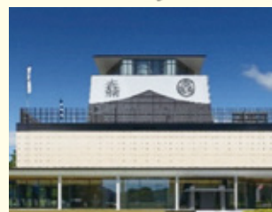
岐阜関ヶ原古戦場記念館