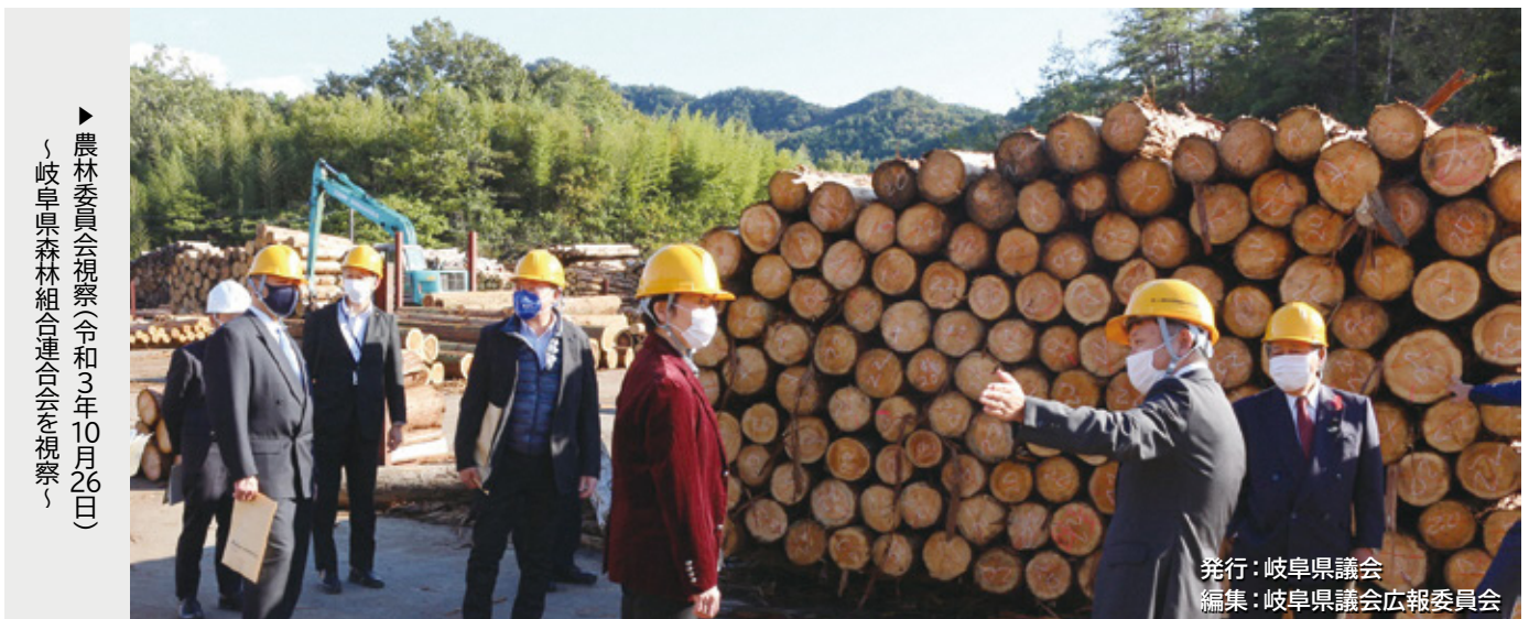
▶ 農林委員会視察(令和3年10月26日) ～岐阜県森林組合連合会を視察～