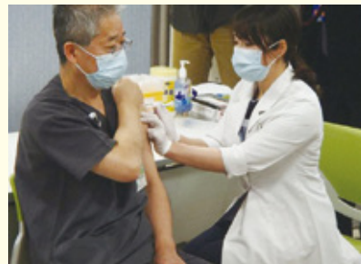
ワクチン接種の様子

質問 ワクチン接種ができない方への支援と、感染拡大傾向にある場合の無料のPCR等検査の体制整備について教えてください。