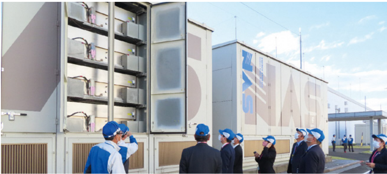
◀ 厚生環境委員会視察(令和3年11月11日) ～日本ガイシ(株)小牧事業所を視察～