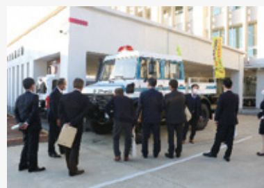
高山警察署を視察

令和3年4月に発足後初の女性隊員が入隊した県警山岳警備隊の活動状況や、東海3県初の公立の不登校特例校として同年4月に開校した草潤中学校の現状と課題について調査しました。