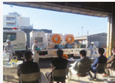
県排水ポンプ車を視察

東海環状自動車道、新水門川排水機場、大野神戸IC周辺の整備のほか、県として初めて配備した排水ポンプ車や養老公園のリニューアル事業の現状と課題について調査しました。