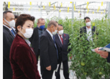
岐阜県スマート農業推進センターを視察

民間の先進的な野菜加工施設、スマート農業の技術を取り入れた機械やハウス、中山間地域の農業技術に関する研究施設のほか、県産材を使用し新技術を活用した建築物や木材の集積場を、それぞれ視察して、その取組みについて調査しました。