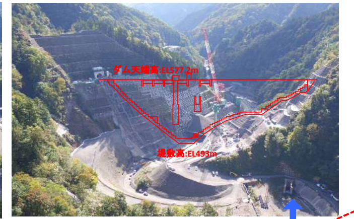
④ ダムサイト状況(上流上空より望む)