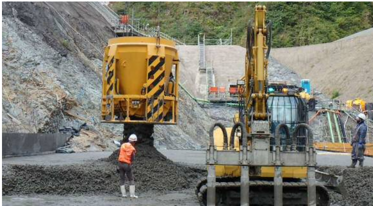
バケットによるコンクリート打設状況