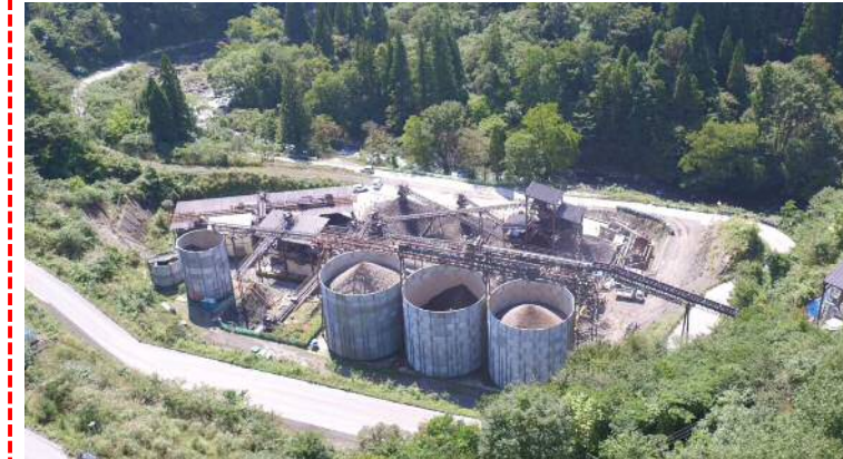
⑤ 骨材製造設備稼働状況