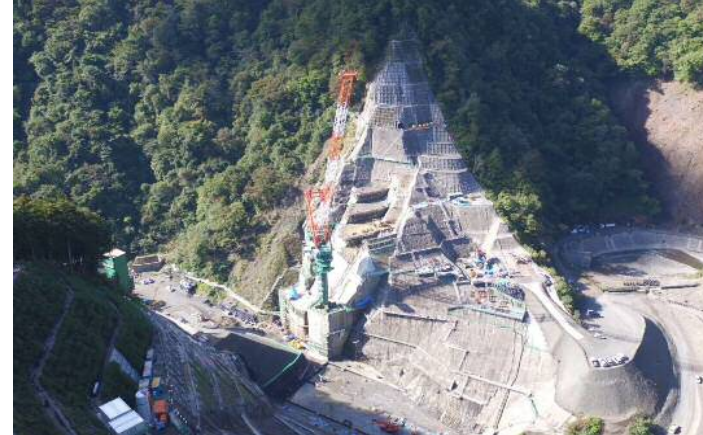
② ダムサイト右岸状況(左岸上空より望む)