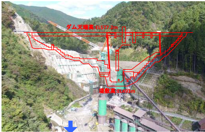
① ダムサイト状況(下流上空より望む)