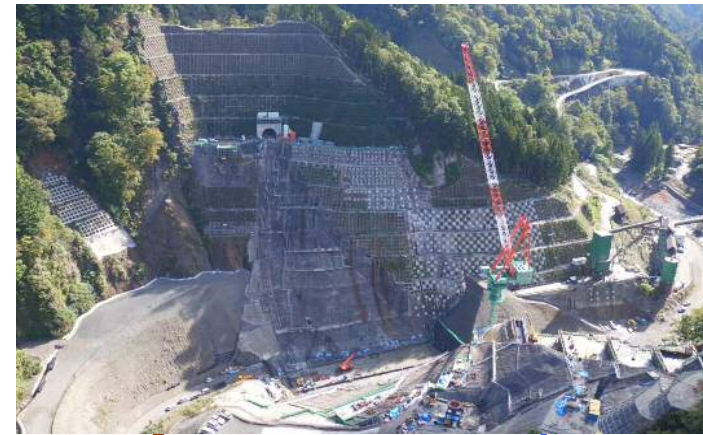
③ ダムサイト左岸状況(右岸上空より望む)