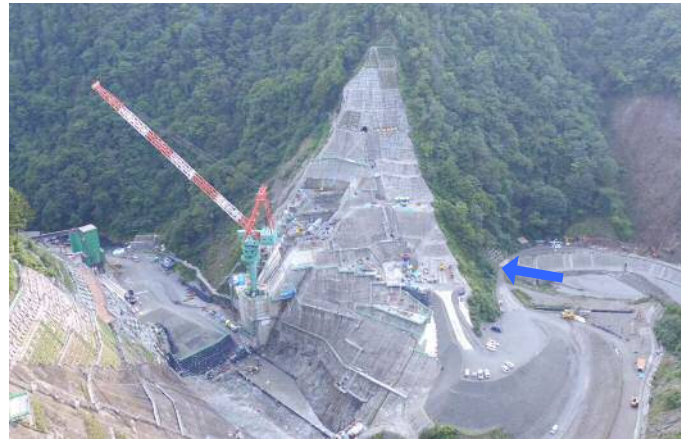
② ダムサイト右岸状況(左岸上空より望む)