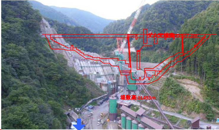
① ダムサイト状況(下流上空より望む)