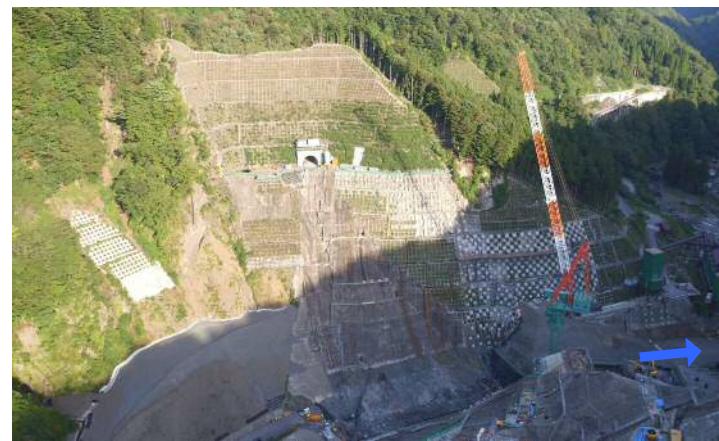
③ ダムサイト左岸状況(右岸上空より望む)