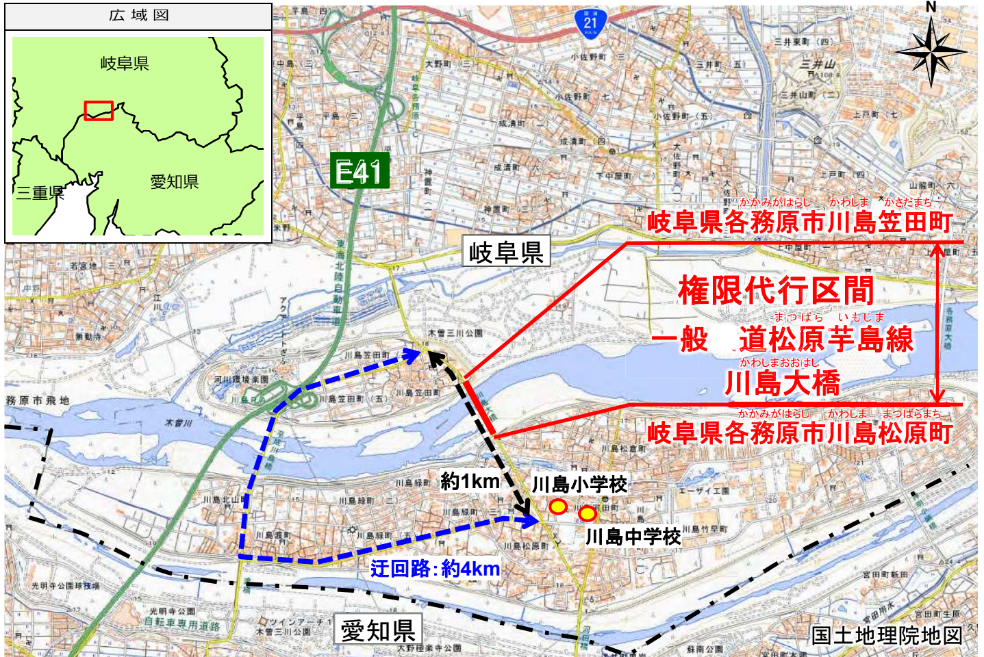
かわしまおおし 川島大橋