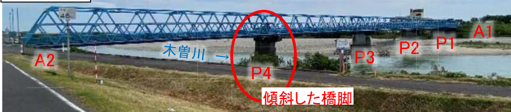
かわしまおおし 〈川島大橋 橋梁諸元〉