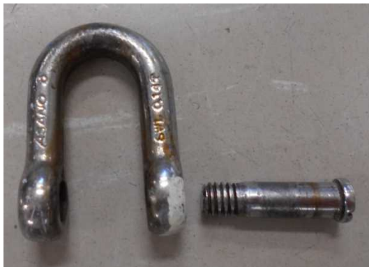
外れたシャックル