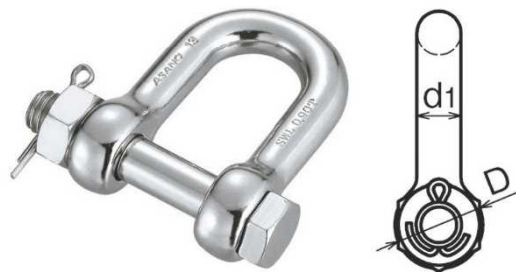
交換後の脱着防止シャックル