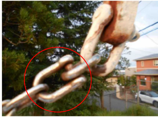
同形状のシャックルの使用状況