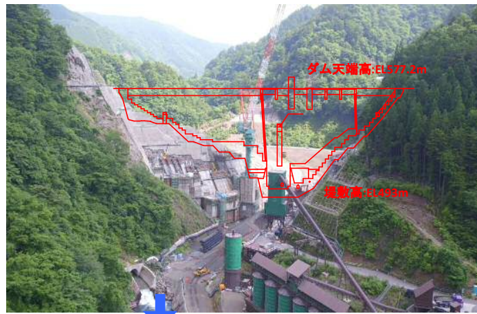
① ダムサイト状況(下流上空より望む)