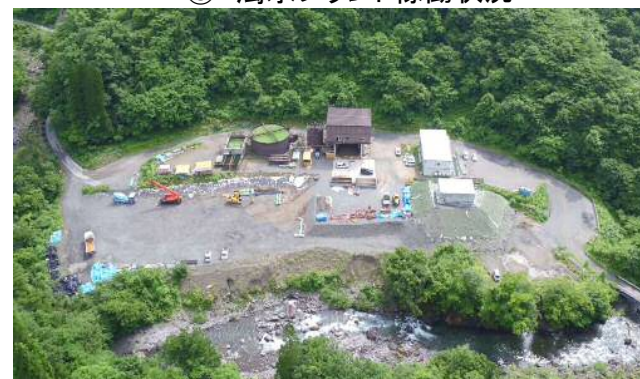
⑥ 濁水プラント稼働状況