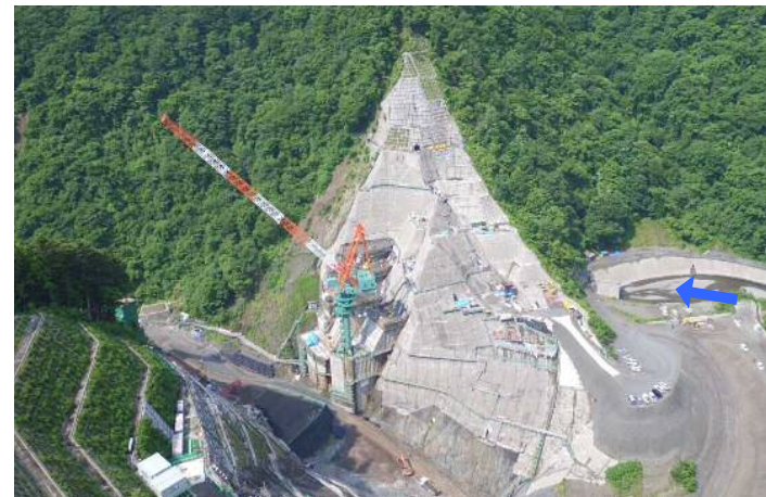
② ダムサイト右岸状況(左岸上空より望む)