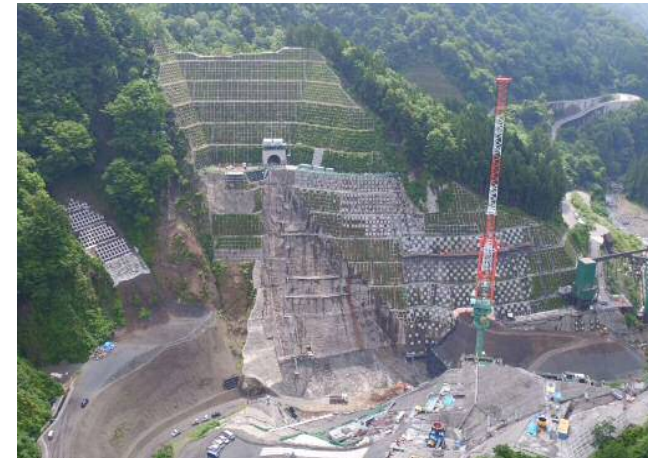
③ ダムサイト左岸状況(右岸上空より望む)