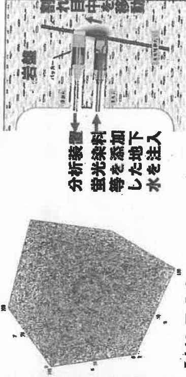
【割れ目分布モデル】 【坑道内での物質移動試験】