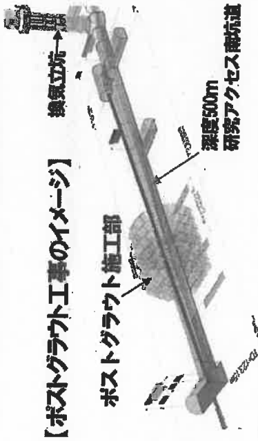
【ポストグラウト工事のイメージ】