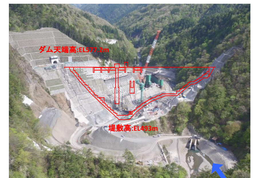
④ ダムサイト状況(上流上空より望む)