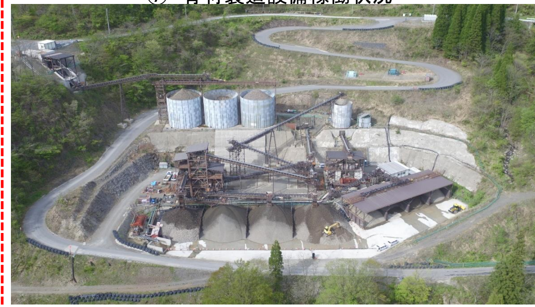
⑦ 骨材製造設備稼働状況