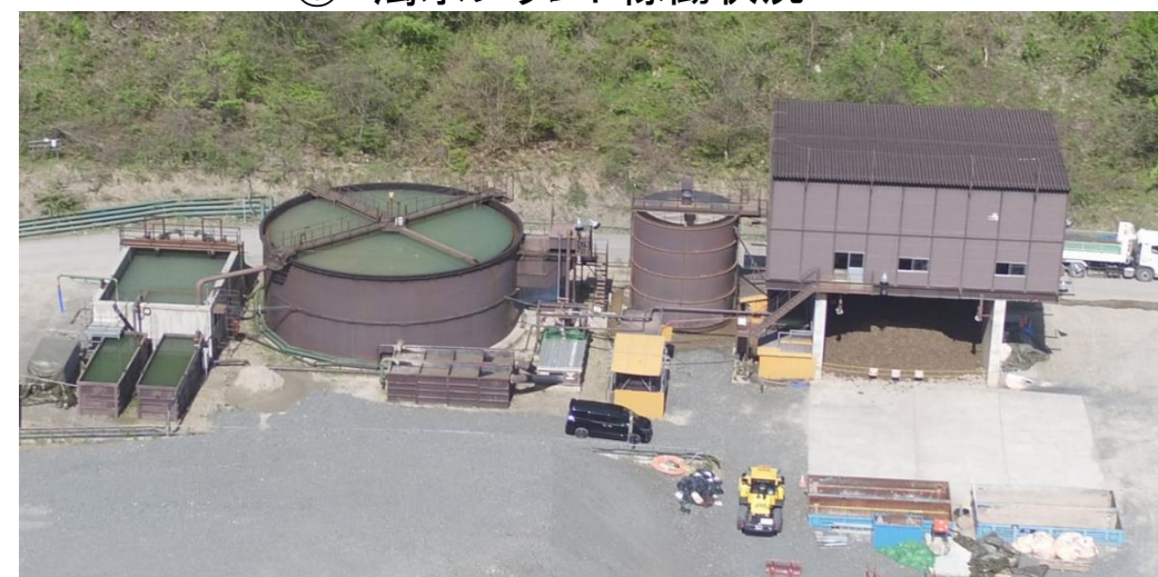
⑥ 濁水プラント稼働状況