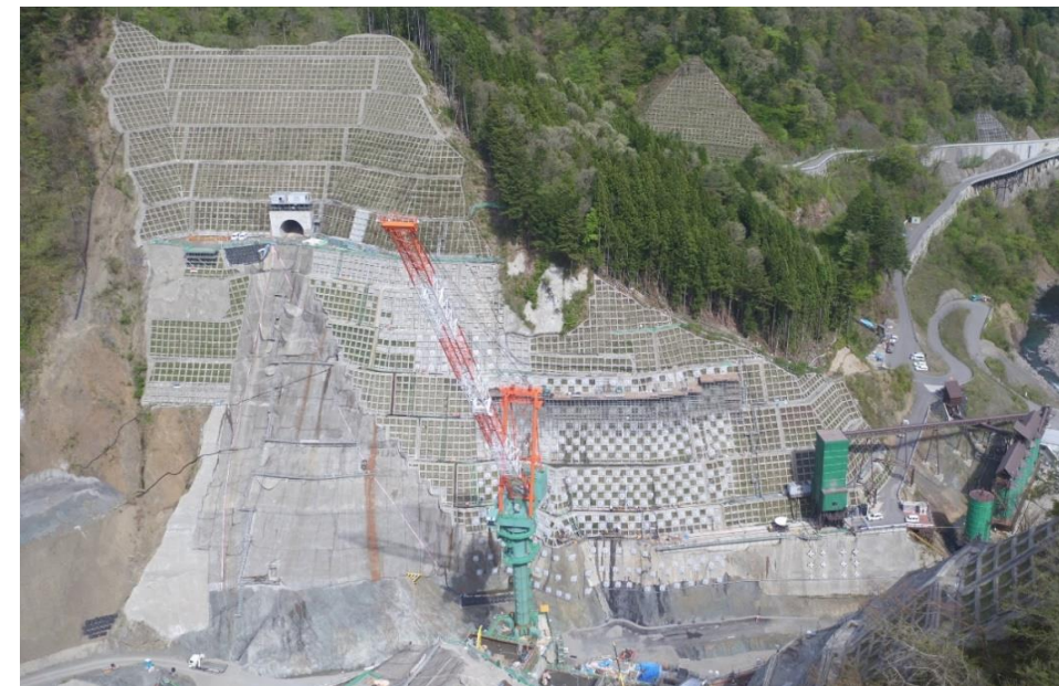
③ ダムサイト左岸状況(右岸上空より望む)