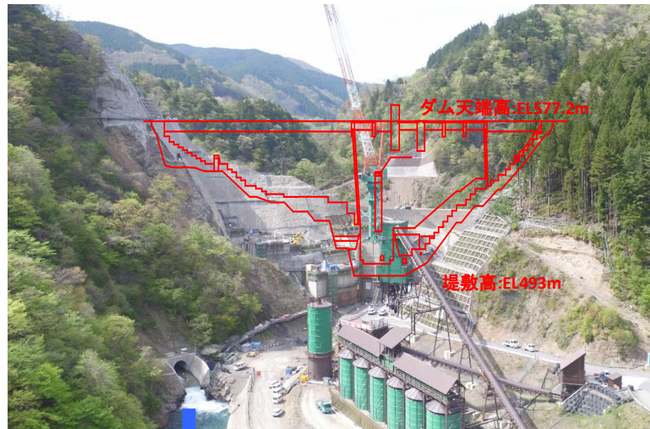
① ダムサイト状況(下流上空より望む)