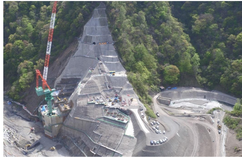
② ダムサイト右岸状況(左岸上空より望む)