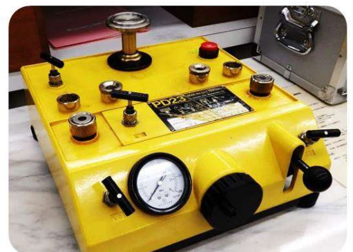
圧力計検査用の基準器