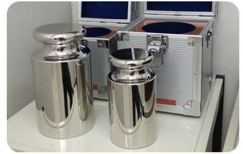
10キログラム・20キログラムの分銅