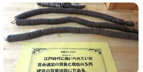
江戸時代に用いられていた寛永通宝の質量と現在の5円硬貨の質量は同じである。