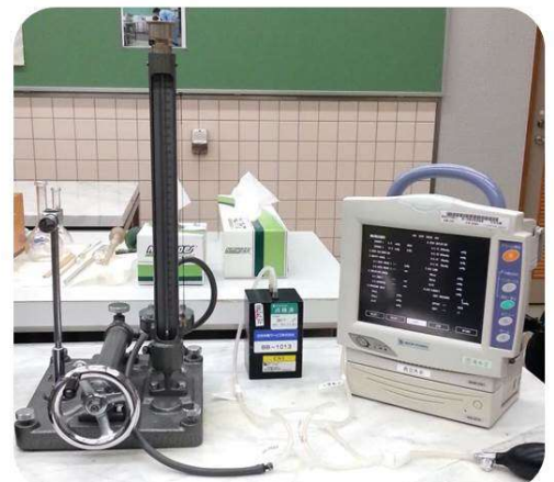
血圧計検定用の基準器