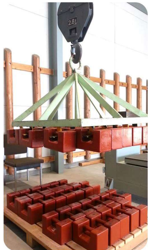
分銅を一度に持ち上げる装置