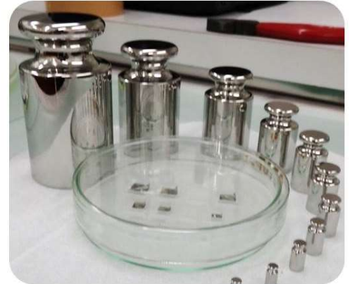
20キログラム～1ミリグラムの特級基準分銅