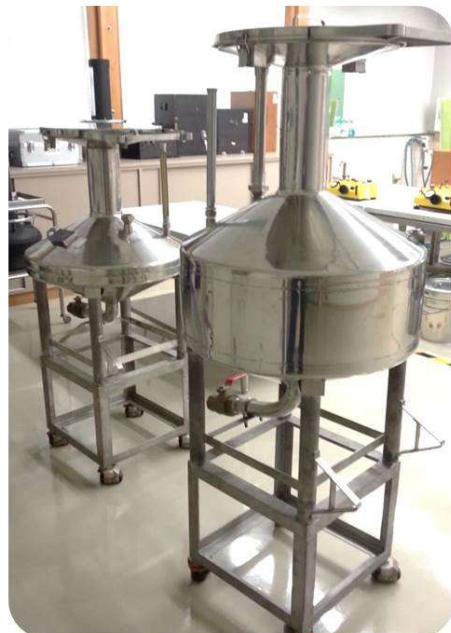
燃料油メーター検定用の基準タンク