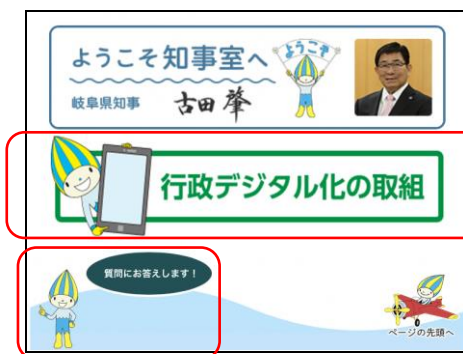
岐阜県庁公式ホームページ