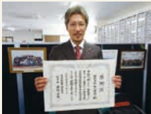
株式会社坂口捺染