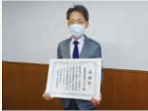
生活協同組合コープぎふ

サポーター企業として3年間継続して、表彰項目のいずれかに該当した企業6社と、3回目の表彰となる4社の計10社に感謝状を授与しました。