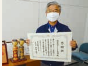
株式会社サン・シング東海