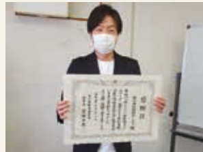
株式会社技研サービス