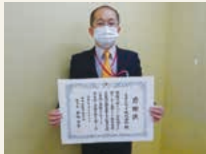
イオンビッグ株式会社

※新型コロナウイルス感染防止対策として、特別支援教育課が各企業を訪問し、授与しました。