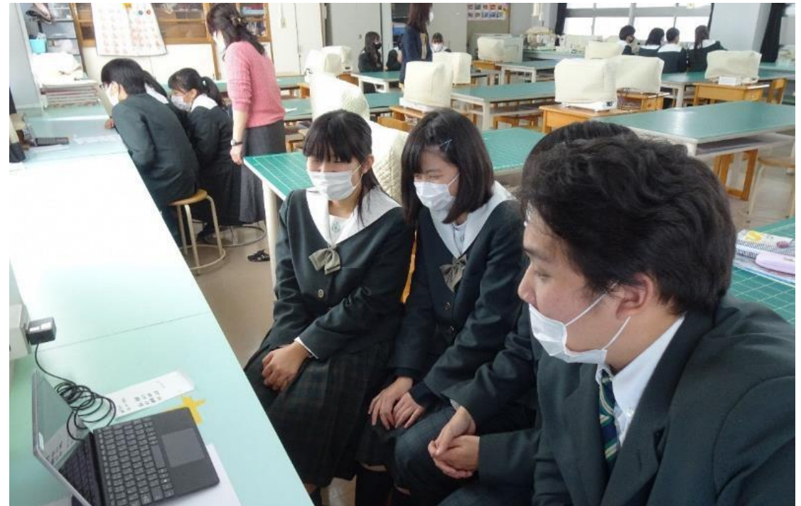
10グループそれぞれが同時に交流