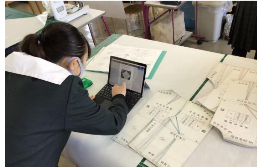
洋服の型紙をタブレットで確認する様子