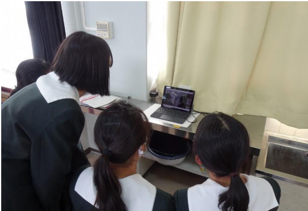
グループに分かれ坂下高校の生徒と交流

Web会議室を10回線使用し、「発達に合わせた服装」に関するグループ交流をした。