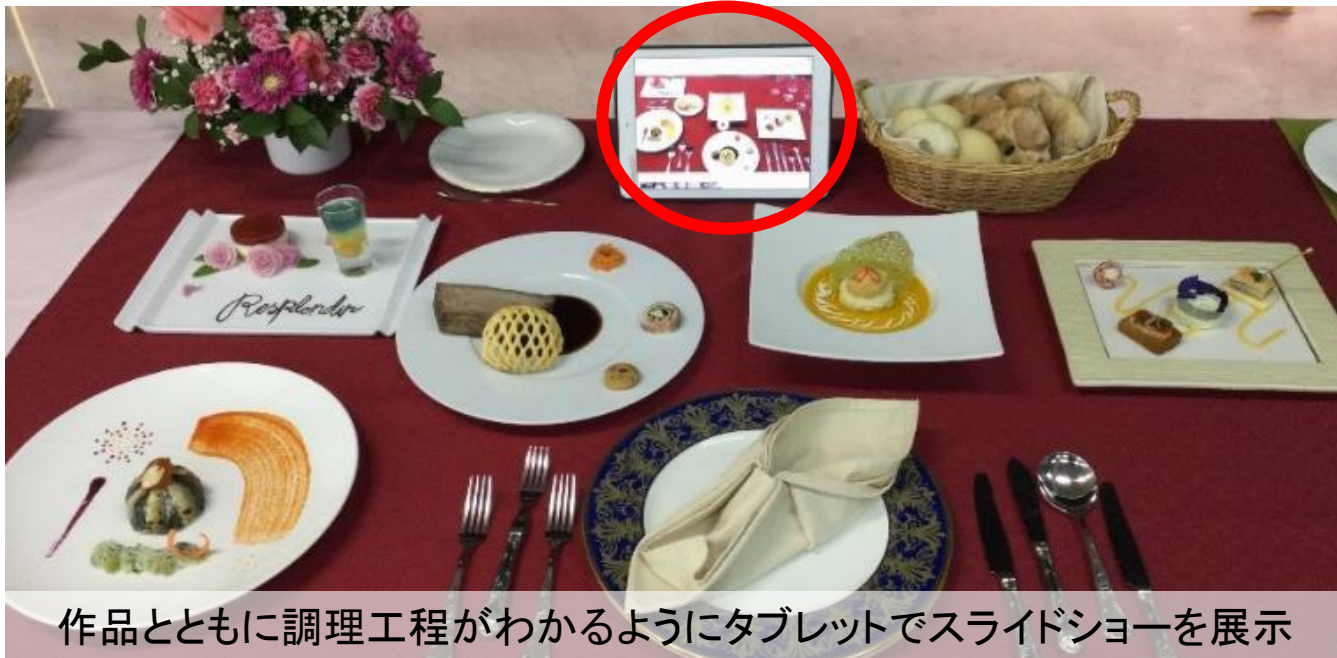
作品とともに調理工程がわかるようにタブレットでスライドショーを展示