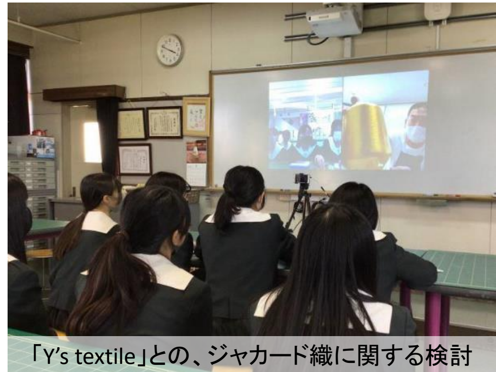
「Y's textile」との、ジャカード織に関する検討