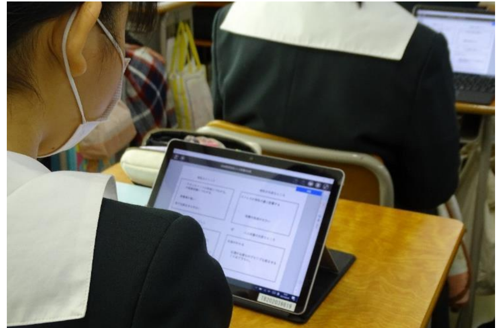
グループの他の人の意見を確認する生徒