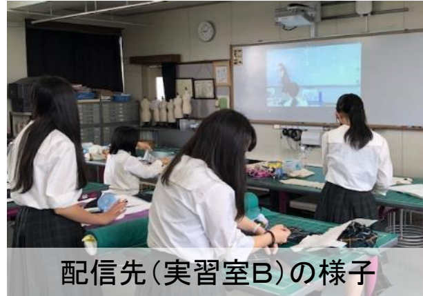
配信先(実習室B)の様子