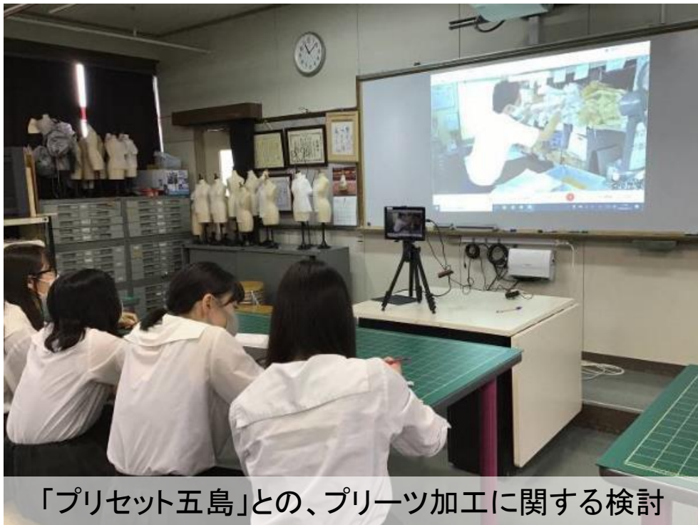
「プリセット五島」との、プリーツ加工に関する検討

タブレットを活用して技法や製作に関して、企業とリモート会議を実施し、卒業研究作品発表会で作成するテキスタイルを考案した。