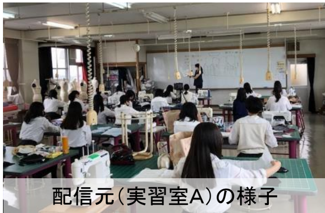
配信元(実習室A)の様子

製作過程の段階見本を写真撮影し、メタモジに貼り付けることで、タブレットで必要な情報を見ながら、製図を書いたり、製作をしたりした。