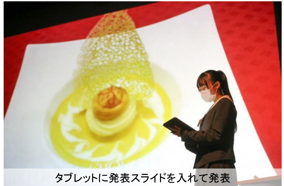
タブレットに発表スライドを入れて発表