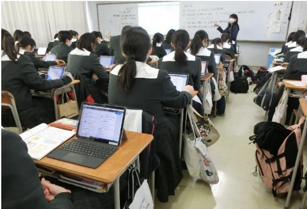
一人一台タブレットで授業を受ける様子

一人一台のタブレットで個々に意見を書き込み、グループ内の意見をホワイトボードにまとめた。