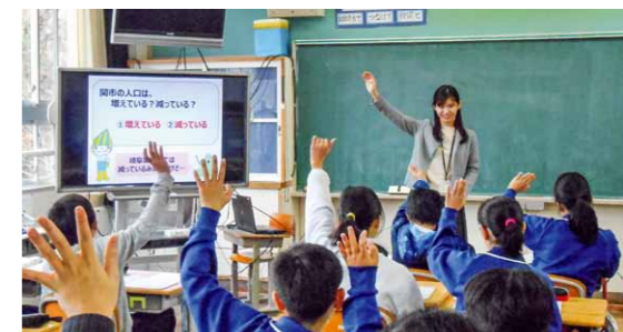
令和元年12月 関市立南ヶ丘小学校6年生のみなさんと