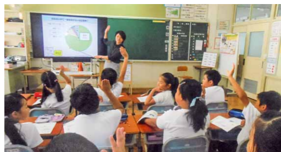
令和元年9月 美濃市立藍見小学校4年生のみなさんと