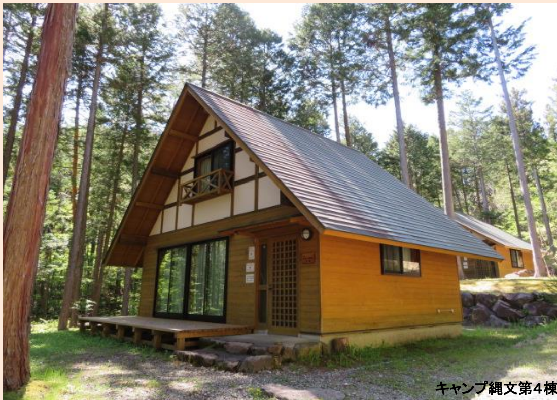
キャンプ縄文第4棟

心身をリフレッシュすることを目的としたコテージです。 電話もテレビもないけれど、森と谷川に囲まれた環境を体験できます。