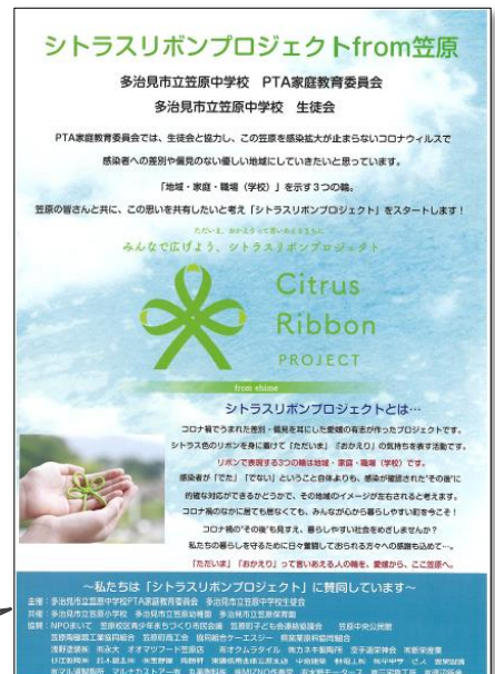
シトラスリボンプロジェクトのチラシ

「コロナ禍の差別や偏見をなくす」という思いは、思っているだけでは伝わりません。シトラスリボンを身に付けることで、意思表示になります。「コロナ禍だから何もやれない」ではなく、「コロナ禍だから何かをやる」という家庭教育委員会の思いは、シトラスリボンとなり、今、地域の方々や子ども達のカバンで揺れています。