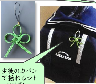
生徒のカバンで揺れるシトラスリボン