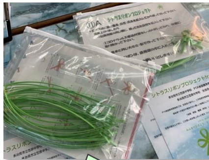
シトラスリボン手作りキット

笠原地区は、地区の伝統行事「いこまい祭り」の踊りの練習に300人も参加して取り組んでいる、人と人とのつながりの深い地域です。笠原中学校家庭教育委員会から始まったプロジェクトは、笠原地区の地域愛が支えとなって、全校へ、地域へ、多治見市へと広がっています。