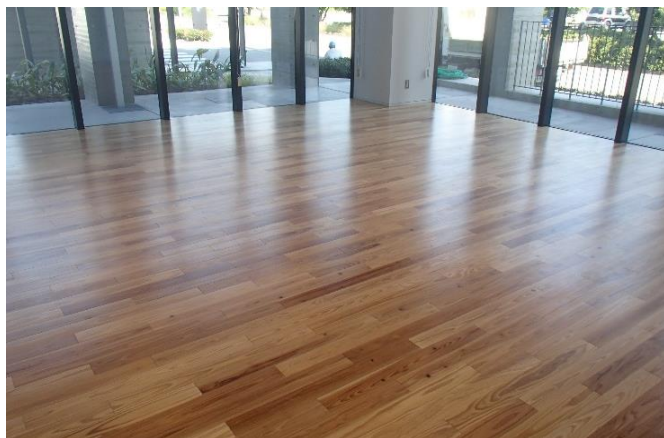
コミュニティルームの床

所在地：不破郡垂井町宮代2957番地の11 電話番号：0584-22-1151 完成：令和元年7月 施設用途：行政施設 木材使用箇所：待合の天井、議場の壁 ほか