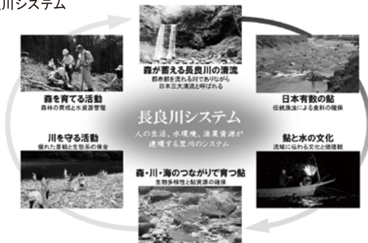
図2-4-3 長良川システム

今後、「清流長良川の鮎」を進化させながら、将来にわたり守り伝えるため、世界農業遺産「清流長良川の鮎」の世界農業遺産保全計画（アクションプラン）に基づく取組みを着実に進める。