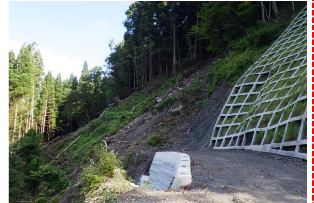
⑤ 下流工事用道路状況