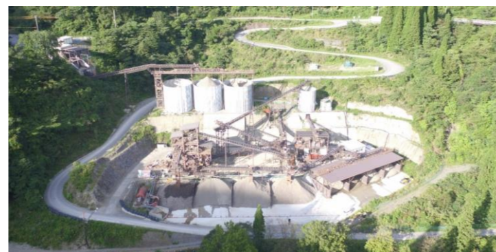
⑥ 骨材製造設備稼働状況