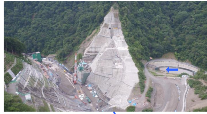
④ ダムサイト右岸状況(左岸上空より望む)