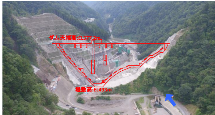
① ダムサイト状況(上流上空より望む)