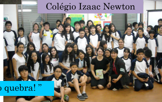
Colégio Izaac Newton