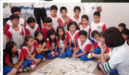
Experiências! “ ovo com capacete não quebra! ”