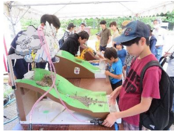
去年砂防展示会活动的情景