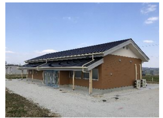
智慧农业推进基地操作中心

为了提高岐阜县内农业的生产和收益，切实推行智慧农业。智慧农业基地设置在海津市，即将开业。农民和有意愿就农人员，在此基地可以体验操作拖拉机机器人和无人机等智慧农业的设备，利用 ICT 技术栽培西红柿的示范实验和信息发布等。