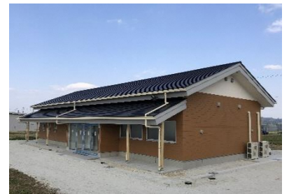
Centro Base de Operações para a Promoção da Agricultura Inteligente

A província de Gifu promove a promoção da Agricultura Inteligente (Smart Agriculture) com o propósito de buscar melhorias na produção