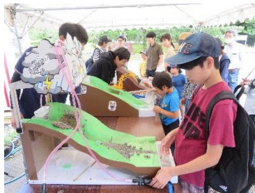
Imagens do festival do ano passado

No mês de junho, inicia-se a estação das chuvas ( tsuyu ) e as chuvas aumentam elevando o risco de ocorrer deslizamentos de terra, portanto, o mês