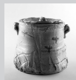
荒川豊藏「志野水指」 1938-41年

多治見市東町 4-2-5 ☎0572(28)3100 休 / 月曜日 (祝日の場合は翌平日) 開館時間 / 10:00 ~ 18:00