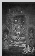
国宝 絹本着色五大尊像 のうち降三世明王像 (来振寺蔵)

山田貢 一越縮緬訪問着 「ながれ」1957年 (世田谷美術館蔵)