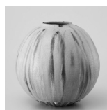
林恭助「黄瀬戸壺」 2009年

9月1日(土) ~ 11月11日(日) 観覧料 / 一般500円 大学生400円