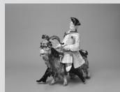
マイセン [雄羊とテラー] 19 世紀中期