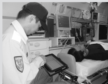
配備されたタブレット端末を使う救急隊員

員がタブレット端末を使って直接入力することで、情報が随時更新され、他の救急隊員がそれらの最新情報を現場で即、利用できるようになりました。救急隊員は医療機関ごとの最新の搬送情報を即時に把握し、患者の搬送先を検討・確認できます。