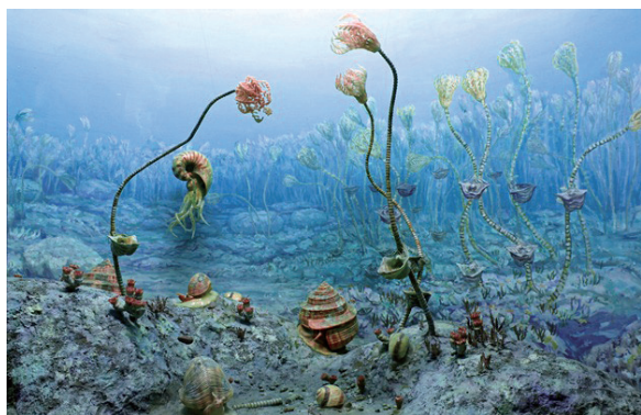
[古生代終わり頃の海]

県内では、恐竜がいた頃よりも古い時代の化石が多く見つかっています。太古の生物の繁栄と大量絶滅。その歩みの記憶を化石や復元画を通してたどります。