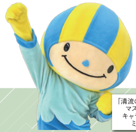
「清流の国ぎふ」 マスコット キャラクター ミナモ

「清流の国ぎふ ミナモ通信」を始めました。 皆さんが、より楽しく、より豊かに生活するために 役立つ身近な情報を、毎月お届けします。