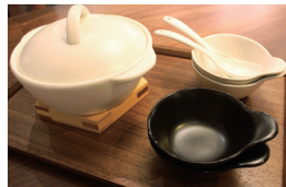
東濃の陶磁器(鍋器)