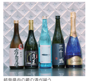
岐阜県内の蔵の酒が揃う