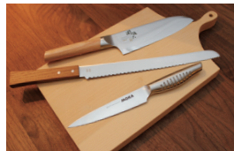
関の刃物とイチゴのCuttingボード