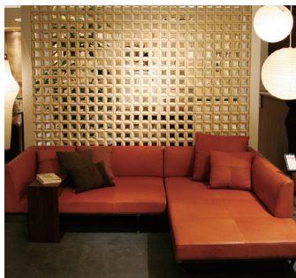
エントランスに使用されている東濃のタイルが訪れる人の目を引く