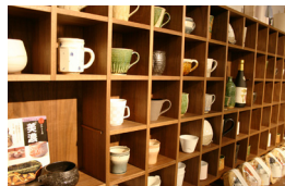
酒器コーナーでは専用のじゅう器で常時50を超える器を展示・販売