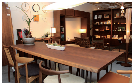
上・左下/飛騨の家具を中心にライフスタイルを提案