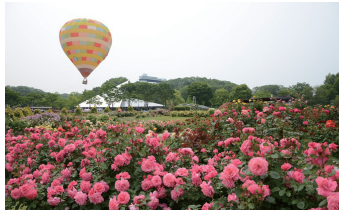
世界のバラ園と気球

世界最大級のバラ園を有する花フェスタ記念公園では、「花で育む 清流の国ぎふ」をテーマに、春のバラの時期に合わせて、「花フェスタ2015ぎふ」を開催します。「美しく、美味しい祭典」をお楽しみください。