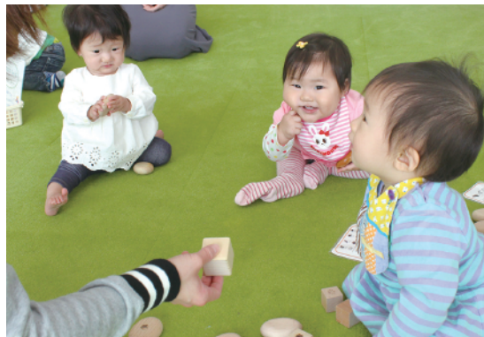
▲「ぎふ木育ひろば」(ぎふメディアコスモス)