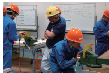
実習設備を備えた研修室

航空機の製造に欠かせない組立や検査の技術を学ぶ研修室を整備しました。航空宇宙産業の現場で求められる技術を磨く場として活用できます。