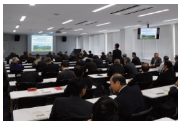
AV機器などを備えた30～150人規模の研修室

産業人材を育てるため、さまざまな研修・セミナーなどを開設しています。専門家によるセミナーでは、幅広い知識・高度な技術を学べます。