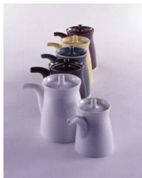
G. Masahiro Mori Hakusan Porcelain Co., Ltd. (G-Type Soysauce Cruet) Disenyo ng 1958