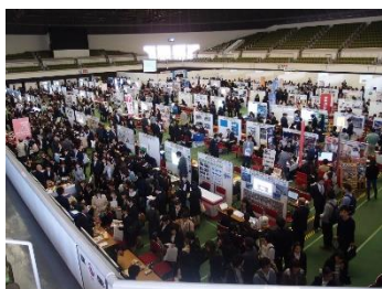
O evento (imagem de 2016)