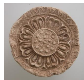
Mirokujiato (Patrimônio Histórico Nacional) Nokimarugawara (telha arredondada de borda do telhado)

As terras de Mino e sua população exerceram um papel importante no destino da maior guerra civil ocorrida na Idade Antiga, a Guerra Jinshin (em 672). Por outro lado, o período em que ocorreu esta guerra civil, o Período Asuka, também foi um período em que as antigas províncias “Minokoku” e “Hidakoku” que originaram a atual região de Mino e Hida, surgiram com mais precisão.