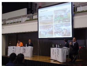
Sessão de debate das empresas (imagem de 2016)

As empresas da província de Gifu estarão reunidas para a realização do maior “pré”-evento para a procura de emprego desta província. O evento conta com um bate-papo com a crítica impressionista Miyuki Shigeta; sessão de debate das empresas; cursos úteis para iniciar a busca por emprego e muito mais. Além dos estudantes do ensino médio, das universidades e das faculdades de curta duração que iniciarão a busca por emprego num futuro próximo, os pais e responsáveis também serão bem-vindos.