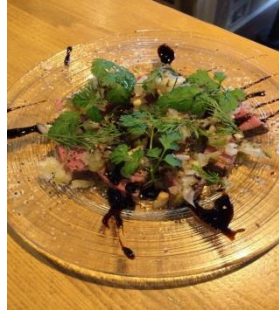
Larawan ng putaheng ihahanda sa ‘Mori no Gochiso Fair’

Sa prepektura ng Gifu, pinangalanan at pino-promote bilang “ Mori no Gochiso ” ang mga Gifu game meat (usa at baboy-ramo).