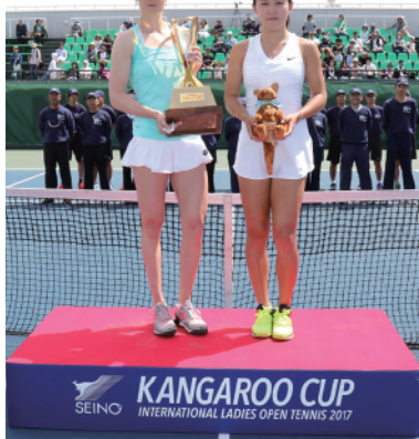
カンガルーカップ国際女子オープンテニス(昨年の様子)