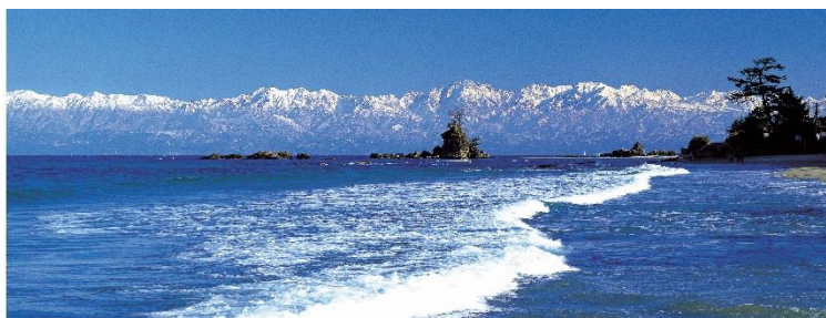
Baía de Toyama (Costa de Amaharashi)

As províncias de Toyama e Gifu estabeleceram o dia 5 de julho como o “Dia do Intercâmbio Toyama/Gifu” e vêm promovendo o intercâmbio. As duas províncias elaboraram em conjunto um desconto no pedágio que permite utilizar a rodovia expressa ilimitadamente dentro de um trecho determinado por um valor fixo. Que tal utilizar esse desconto e fazer uma viagem de carro para conhecer os atrativos de Toyama como as “maravilhosas paisagens da baía de Toyama” ou os “frutos do mar fresquinhos”, por exemplo? Está sendo distribuído nas paradas e nos Michi no Eki dessa região turística, um guia “Viagem de carro Hida/Toyama” que contém indicações de roteiros.