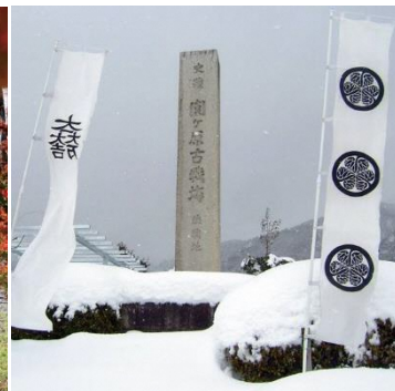
Campo da batalha de Sekigahara (inverno)

Será realizado um concurso de fotografia de Sekigahara, que tem o objetivo de difundir os atrativos de “Sekigahara – o palco da divisão do reino” para todo o país. Qualquer pessoa poderá participar, seja fotógrafos amadores ou profissionais.