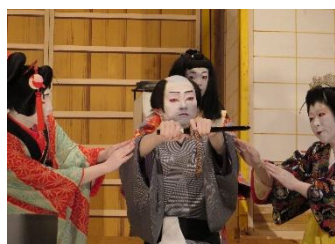
Iiji Gomouza Kabuki Hozonkai

Será realizado o espetáculo de Jikabuki dos grupos Kushihara Kabuki Hozonkai e do Iiji Gomouza Kabuki Hozonkai (ambos da cidade de Ena) e o espetáculo do regresso triunfal dos grupos Kashimo Kabuki Hozonkai (Nakatsugawa-shi) e do Houou Kabuki Hozonkai (Gero-shi) que estiveram nos palcos da França e da Espanha em outubro deste ano. Haverá ainda a promoção dos pontos turísticos e a venda de produtos exclusivos das cidades origem dos grupos que irão se apresentar, portanto, não percam!