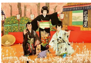
Kushihara Kabuki Hozonkai