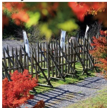
Campo da batalha de Sekigahara (outono)