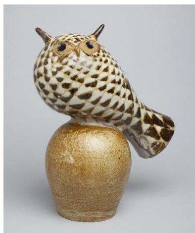
Michael Schilkin <Escultura (Coruja)> Anos de 1950 Cerâmicas Arabia Coleção de Kakkonen ©KUVASTO, Helsinki & JASPAR, Tokyo, 2018 C2428

A autêntica cerâmica da Finlândia surgiu em um contexto em que havia forte tendência pela independência da Rússia no final do século 19. Ela se desenvolveu ao ponto de criar uma tendência mundial em meados do século 20. Essa exposição mostrará o fascínio da cerâmica finlandesa através das peças produzidas desde o