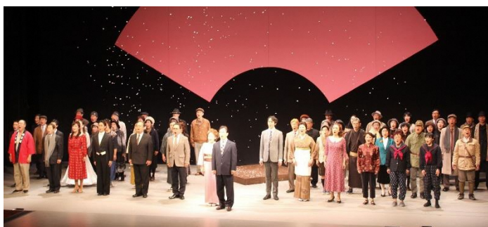
Espetáculo do ano passado

“Chiune Sugihara”, o Schindler do Japão, que através da emissão do visto de trânsito, salvou a vida de 6.000 judeus: “Não podia ver morrer as milhares de pessoas que me procuravam”. Os descendentes dos judeus que ele salvou hoje são mais de 10 mil e há sentimentos de gratidão por todo o mundo. Aprecie esta ópera que reproduz essa emocionante história real.