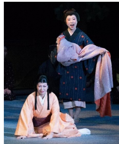
Imagens do ano passado

A Fundação para Educação e Cultura de Gifu vem realizando uma ópera original que aborda como tema a história e a cultura de diversas regiões desta província. Este ano, celebra-se 20 anos desde o primeiro espetáculo e haverá a