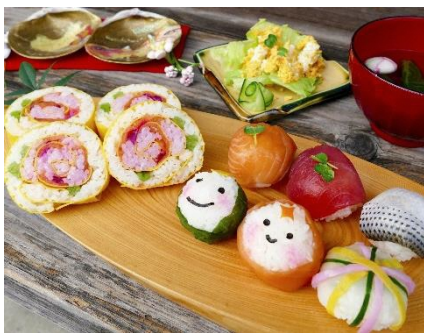
Mitake Hanazushi e Temarizushi

É um programa turístico da província de Gifu para caminhar se divertindo ao passar pelas 17 cidades estações e percorrer os 126,5