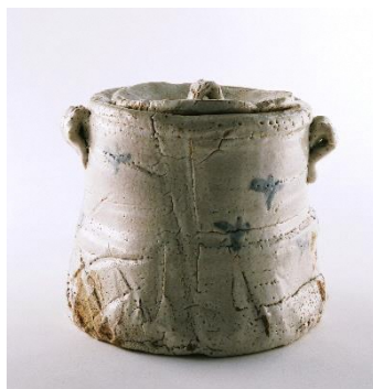
Toyozo Arakawa 《Shino Mizusashi》 Ano 1938-41 Acervo do Museu de Arte Cerâmica Moderna de Gifu

É uma exposição que apresenta a história da arte cerâmica moderna de Mino, com foco no movimento renascentista a partir dos anos iniciais da Era Showa. Veja a história da arte cerâmica de Mino desenvolvida pelos artistas cerâmicos, com muito respeito à tradição.